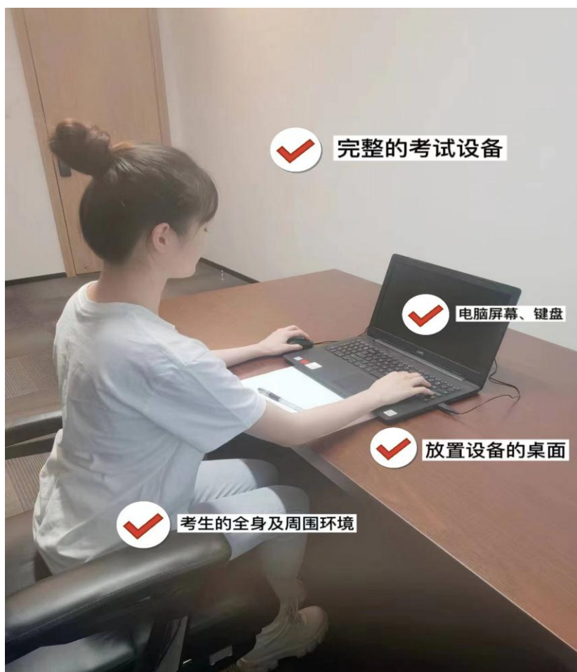
图二：设备摆放正面视角