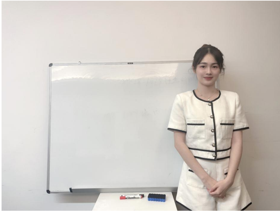
图三：面试环节电脑端正面视角