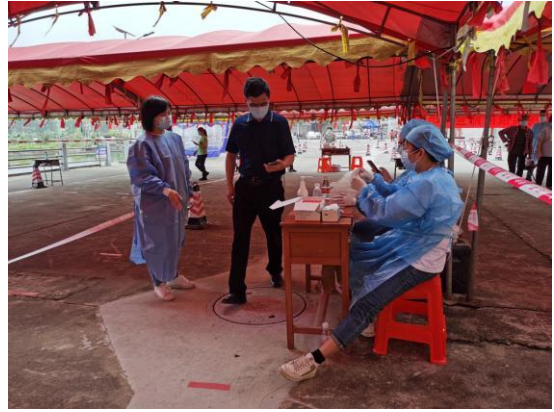
△支援队伍在各核酸采样点维持秩序