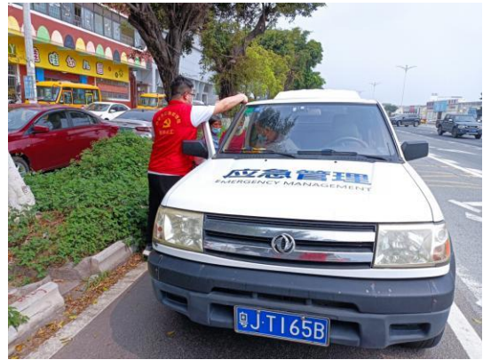
△支援队伍走进田边、市场，为群众送服务