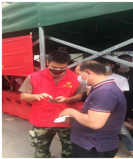
△支援队伍在水口医院协助群众登记和维持秩序