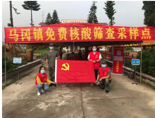
△党旗再次飘扬在马冈镇各核酸采样点