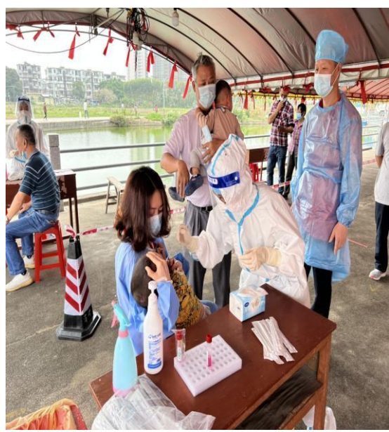
△支援队伍为群众送上暖心服务