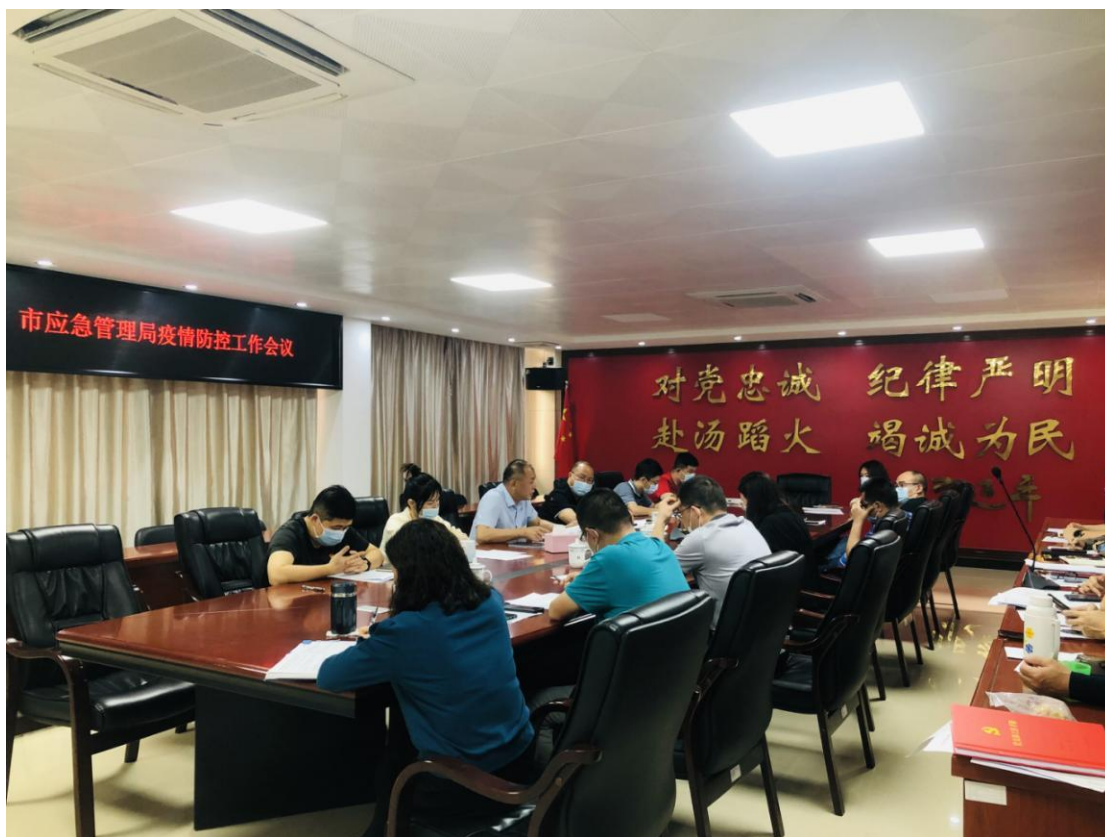
△市应急管理局部署疫情防控工作

3月18日上午，市应急管理局党委闻令而动，积极响应市委市政府倡议，召开全局疫情防控工作会议，部署局机关的疫情防控工作，以局主要领导为队长成立市应急管理局疫情防控应急支援工作队，组织党员干部到镇（街道）、村（社区）补充一线岗位力量，配合做好疫苗接种和免费核酸检测工作，助力打赢“外防输入、内防反弹”的疫情防控战。