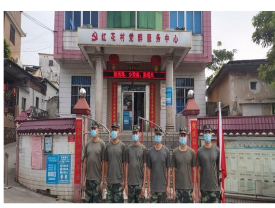
△各志愿队伍到达村委会开展支援工作