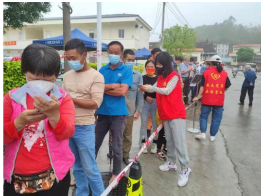
△支援队伍协助群众生成核酸检测“葵花码”