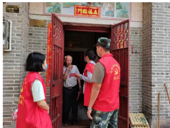
△支援队伍上门入户向老人普及疫苗接种知识