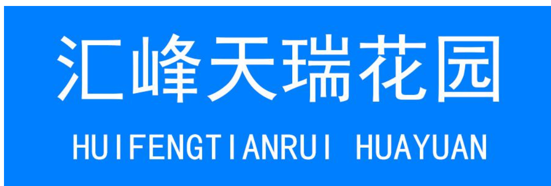
图 1 住宅小区地名标识标志设置样式(参考)